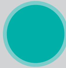
Seminārs + abi "Case Study"