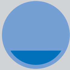
Seminārs + "Case Study" Nr. 2